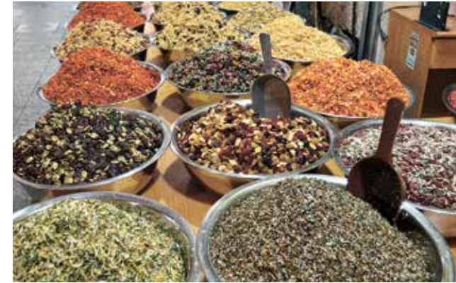
חווית טעמים בשוק מחנה יהודה

העיקריים. ההבטחה ל-15 דקות נסי' עה מתבררת כנכונה וכאשר רצינו לה- גיע לאזורים כמו שוק מחנה יהודה או מוזיאון ירושלים, עשינו זאת בקלות. אבל לפני שנספר קצת על החי- דושים במקומות שהיינו בהם, כמה מילים על המלון. המלון הוקם ע"י ארגון נשות הדסה העולמי בשנת 2006 ולפני 4 שנים הוא עבר שיפוץ והפך למלון שאפשר להגדירו כמלון ארבעה כוכבים, אם היה דירוג מלונות בישראל. מה זה אומר? 129 חדרי בוטיק מעוצבים ברמות שונות, כולל חדרי בוטיק, חדרי משפחה, חדרי דלקס,