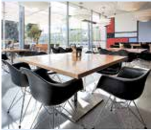
מסעדת מודרן במוזיאון ישראל

מלון יהודה, 02-6322777, www.byh.co.il גן החיות התנ"כי, 02-6750111, www.jerusalemzoo.org.il מוזיאון ישראל, www.imjnet.org.il מסעדת מודרן, 02-6480862, www.modern.co.il יאאלה בסטה 054-6646684, www.yallabasta.co.il אירועי תרבות בירושלים www.jerusalemseason.com