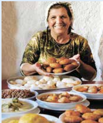
תפריט ביתי מנצח. מסעדת אמא

מסעדת אמא היא ללא ספק אחד המוסדות הקולינאריים של ירושלים. והסיבות לכך ברורות: תפריט פשוט, ביתי וכשר, המבוסס על חומרי גלם טריים, שיטות בישול מסורתיות ומנות מנצחות, שבראשן מגוון מנות הקובה והממולאים שטעמן יצא למרחוק.