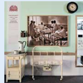
אבני דרך של רפואה מקומית

דברי ימי העיר בראי הרפואה והאמונה בתערוכה הפרושת את הגיליון הרפואי של ירושלים, ומציגה סיפור של אלפי שנותיה בנתיב אבני הדרך של הרפואה, ברצף שלובים בו חולי ומגפה ומגדל ריפוי בנס ומבחן האמונה, תמציתם של החיים רבי הרבדים והניגודים בעיר הקודש. המבקרים עוברים בין תקופות, אירועים ומוצגים ייחודיים, שחלקם נחשפים בפעם הראשונה לציבור הרחב. בתערוכה מוצגים פרקים בהיסטוריה של העיר: התרופות שהומצאו לראשונה בעיר (הבלזם) ודימויים רפואיים נדירים. פרשיות לא מוכרות ומוצגים מפתיעים מבתי החולים הראשונים שהוקמו בעיר לצד הפצים, תעודות, תמונות ופריטים מארכיונים בארץ ומחול. לצד אלו מוצג ארון התרופות הירושלמי מימי התנ"ך ועד ימינו, כלי רפואה שהושאלו מחדרי הדרים של מנזרים ירושלמיים וחפצים ייחודיים מאוספים פרטיים וירושות שעוברות במשפחות ותיקות מזה מאות שנים ועוד. אוצרת: ד"ר נירית שלו-כליפא. התערוכה, בתמיכת חברת "טבע תעשיות פרמצבטיות בע"מ", מוצגת במוזיאון מגדל דוד עד אפריל 2015. [לפרטים: www.towerofdavid.org.il ]