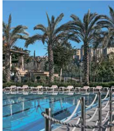
מלון יהודה. חדר גן והבריכה

קדיף עוף ואגוזים של ג'קסון, סו-פריטו ארטישוק ירושלמי וערמונים ועוד. האווירה נעימה, משוחררת יותר מזו של המוזיאון, האוכל טעים וייחודי בחלקו והשירות מזמין. אפשרות נוספת היא להמשיך עם המכונית למרחק קצר יחסית ולהגיע לשוק מחנה יהודה. מילים רבות נכתבו עד כה על השוק הססגוני והנעים, הכולל מספר רב של מסעדות, ברים ובתי קפה מודרניים שנפתחו בו בשנים